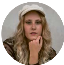
Celina Larab Dramaturgie & Text

Als Lichtdesigner wurde Duncan für das beste Lichtdesign der ugandischen Produktion von The Phantom of the Opera nominiert. Außerdem absolvierte er 2023 ein Praktikum im Bereich Lichtdesign beim Festival Spielart. Derzeit studiert er Regie an der Bayerischen Theaterakademie August Everding in München, wo er zuletzt eine Adaption von Wolfram Lotz' Die lächerliche Finsternis inszenierte.